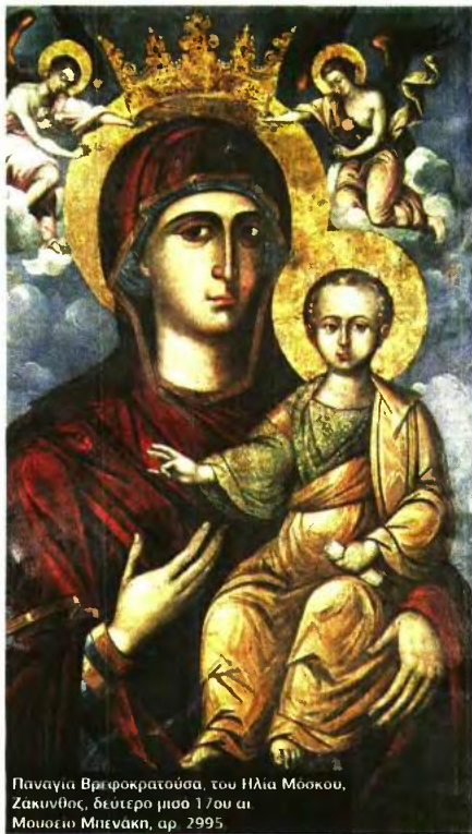
Παναγία Βρεφοκρατούσα, του Ηλία Μόσκου, Ζάκυνθος, δεύτερο μισό 17ου αι. Μουσείο Μπενάκη, αρ. 2995.