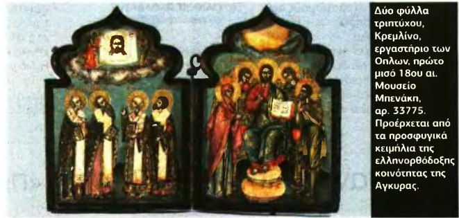
Δύο φύλλα τριπτύκου, Κρεμλίνο, εργαστήριο των Ούλων, πρώτο μισό 18ου αι. Μουσείο Μπενάκη, αρ. 33775. Πρόκειται από τα προσφυγικά κειμήλια της ελληνορθόδοξης κοινότητας της Αγκυρας.

ΞΕΝΙΑ ΣΤΟΥΚΑ xstouka@e-typos.com το Ινστιτούτο Μεσογειακών Σπουδών - ΙΤΕ και δεύτερο ανάδοχο του Μουσείου Μπενάκη. Ογδόντα εκκλησιαστικά έργα και εικόνες -τα περισσότερα παλαιές και νέες δωρεές ιδιωτών- «βγαίνουν» από τις αποθήκες του Μουσείου Μπενάκη και αφηγούνται την έννοια του χώρου πέρα από τα γεωγραφικά όρια ως κοινωνική κατασκευή της ορθόδοξης κοινότητας από πληθυσμούς με διαφορετικές παραδόσεις, πολιτική υπόσταση και γλώσσα. «Η έκθεση διερευνά την ποικιλομορφία των εικόνων που διακινούνταν την περίοδο από τον 17ο μέχρι τον 19ο αιώνα στον ελληνορθόδοξο χώρο. Για να καταλάβει κανείς αυτή την περίοδο, αρκεί να δει την ποικιλομορφία εικονογραφίας και ύφους, αλλά και την επικοινωνία μεταξύ περιοχών με ορθόδοξους πληθυσμούς όπου εκφράζονται οι ιδιαίτερες αισθητικές προτιμήσεις και λατρευτικές πρακτικές των παραγγελιοδοτών», περιγράφει στον «Ε.Τ.» η επιμελήτρια της έκθεσης, Αναστασία Δρανδάκη, και μας εξηγεί τα πολλά και ενδιαφέροντα επίπεδα ανάγνωσης που συγκροτούν την εικαστική περιήγηση. Το κοινό βυζαντινό υπόβαθρο δημιουργούσε μια ενιαία παρακαταθήκη εικονογραφικών θεμάτων και τεχνικών λύσεων που εμπλουτιζόνταν διαρκώς και με ποικίλους τρόπους σε κάθε κέντρο παραγωγής, χωρίς ωστόσο να διαταράσσονται οι σύνδεσμοι που επέτρεπαν τη διακίνηση των εικόνων από τόπο σε τόπο και την κοινή χρήση τους στον ίδιο λατρευτικό χώρο από τη Ρωσία και την Ουκρανία ως τα Επτάνησα, την Κρήτη και τη Μικρά Ασία. ■