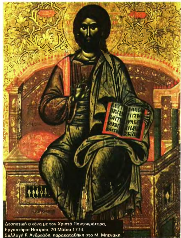
Θεολογική εικόνα με τον Χριστό Παντοκράτορα, Εργαστήριο Ηπειρού, 20 Μαΐου 1733. Συλλογή Ρ. Ανδρεάδη, παρακαταθήκη στο Μ. Μπενάκη.