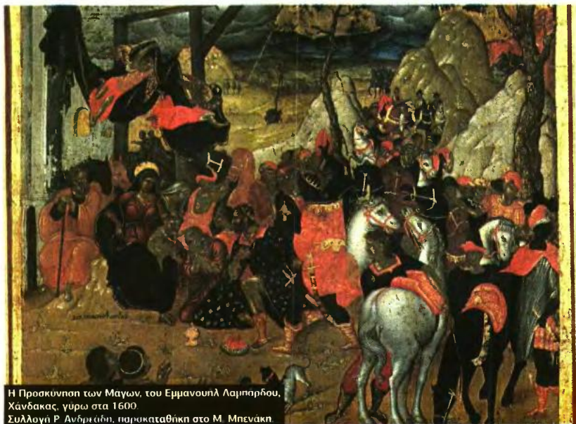
Η Προσκύνηση των Μαγών, του Εμμανουήλ Λαμπροπούλου, Χανδάκας, γύρω στα 1600. Συλλογή Ρ. Ανδρεάδη, παρακαταθήκη στο Μ. Μπενάκη.